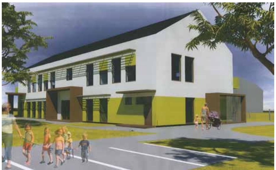
vizualizace nové MŠ, WAREX spol. s r.o.

„My voliči zastupitelů jsme proti bourání budov v Jiříkově...“